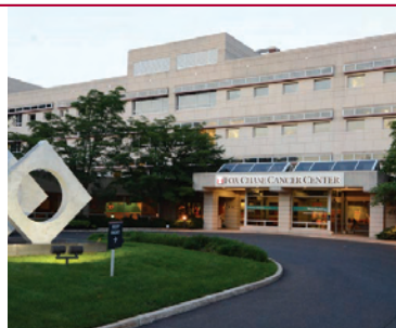
Онкологический центр Fox Chase 333 Cottman Avenue Филадельфия, Пенсильвания 19111-2497

Онкологический центр Fox Chase расположен в Филадельфии, штат Пенсильвания, и легкодоступен для пациентов со всего мира.